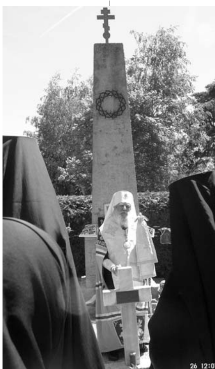
Митрополит Лавр на русском кладбище в Лиенце

Перед октябрьским переворотом население Всевеликого Войска Донского согласно переписи 1917 г., составляло около 4 миллионов человек, не считая казачье население Кубани, Терека, Сибирских, Семиреченских, Амурских и других казаков в местах их компактного проживания. На 15 марта 1922 г. на Дону осталось лишь около 1,5 млн. человек – в результате исхода Белой армии и репрессий «расказачивания». Расстреляны были все без исключения казаки, занимавшие служебные