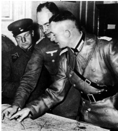
Союзники делят Польшу. Белосток, сентябрь 1939 г. Офицеры Вермахта и командиры РККА обсуждают размещение войск вдоль демаркационной линии.